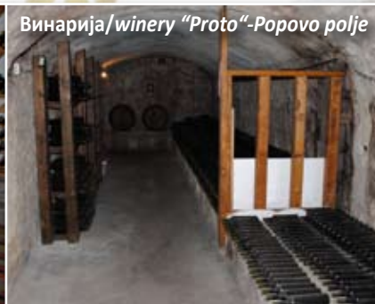
Винарија/winery "Proto"-Popovo polje