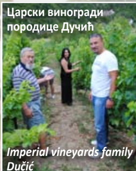
Царски виногради породице Дучић

Перовић (Арсланагић) мост је један од најмонументалнијих и најелегантнијих мостова шеснаестог вијека а који се протеже преко највеће понорнице у Европи, бистре Требишњице. / Perović's (Arslanagić's) bridge is one of the most monumental and most elegant bridges of the 16th century, which extends over the longest undercurrent river, the clear Trebisnjica.